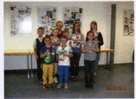
Die Teilnehmer mit ihren „Pokalen“